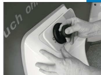
Scheibe wie oben herausziehen...