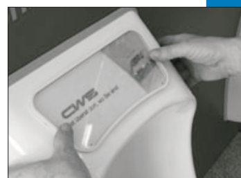
Scheibe in Öffnung ein- legen und am Rand bündig andrücken.